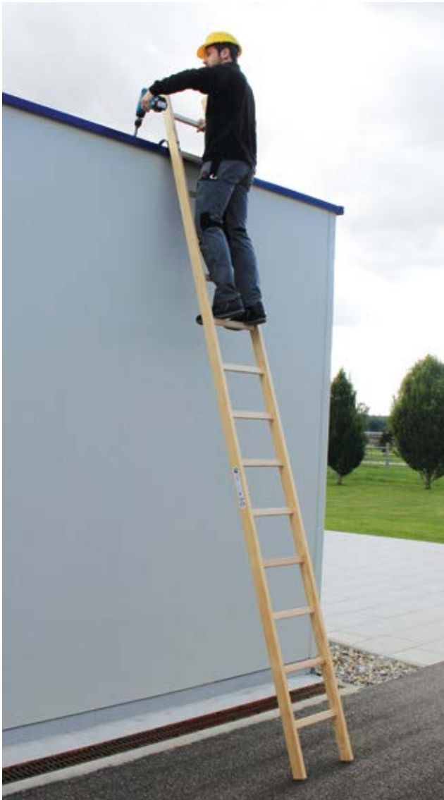
Abb. Bestell-Nr. 33114, Fixierung der Leiter mit Haken