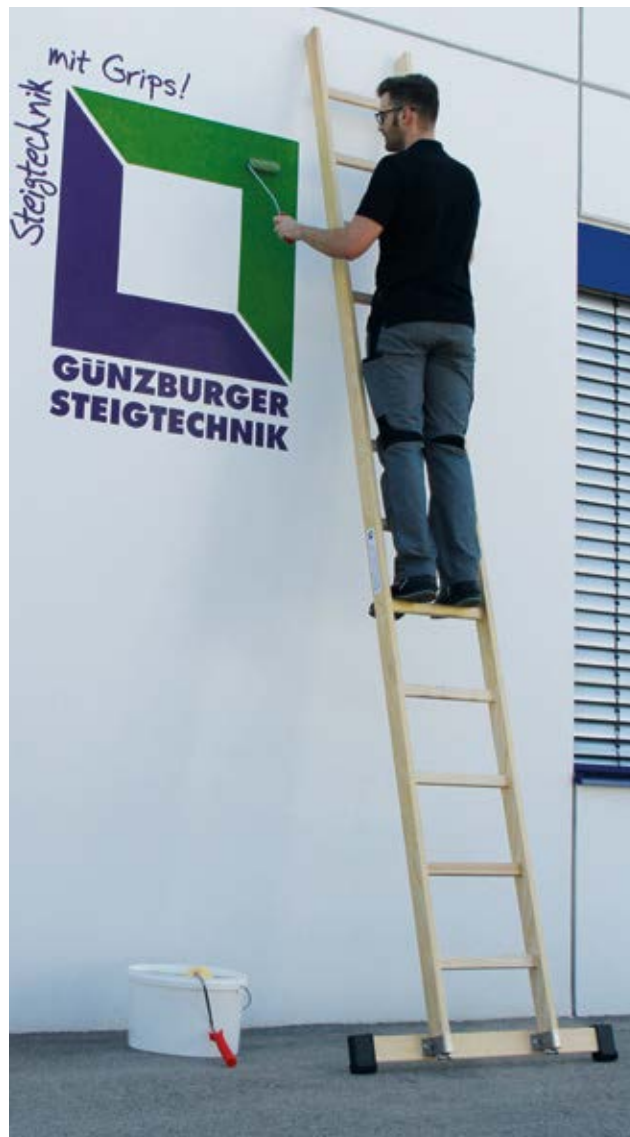
Abb. Bestell-Nr. 33115

Die Standard-Traverse sorgt für einen sicheren Stand bei Anlegeleitern über 3,0m. Optimale Traversenbreiten in Kombination mit rutschsicheren Leiternschuhen, erhöhen die Sicherheit beim Aufstieg.