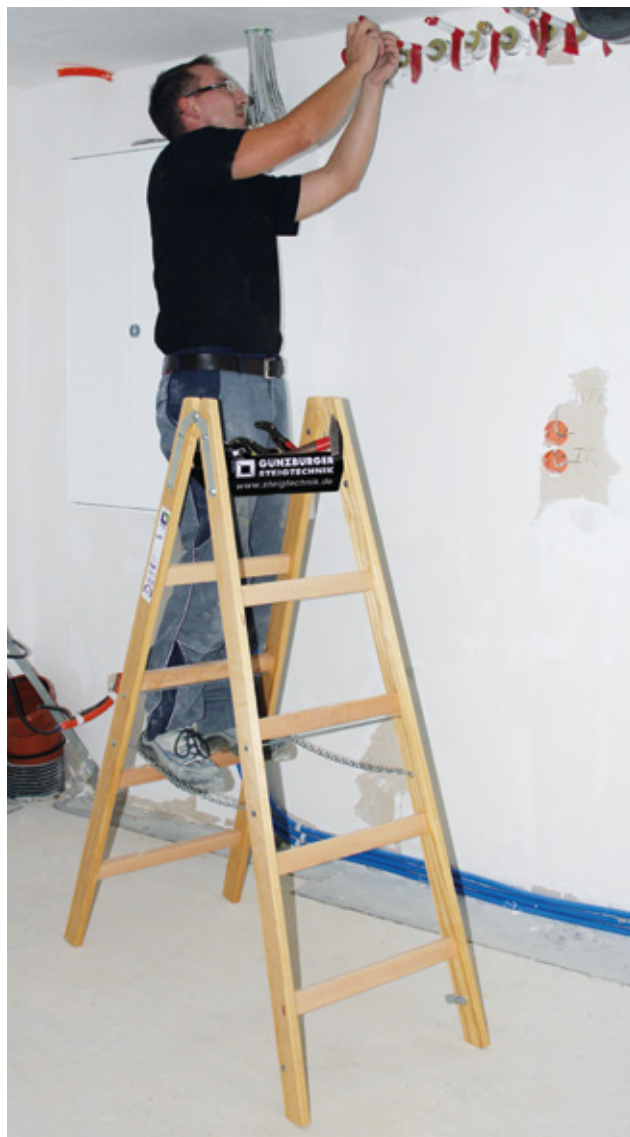
Abb. Bestell-Nr. 33210