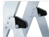
Abb. Bestell-Nr. 51096

Spreizsicherung mit 2 hochfesten Perlongurten. Hohe Standsicherheit durch konische Bauweise. Stufenabstand 235 mm, Leiterneigung 20°.