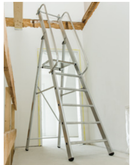
Abb. Bestell-Nr. 51096