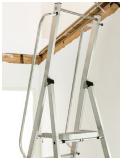
Beidseitig vormontierter Handlauf